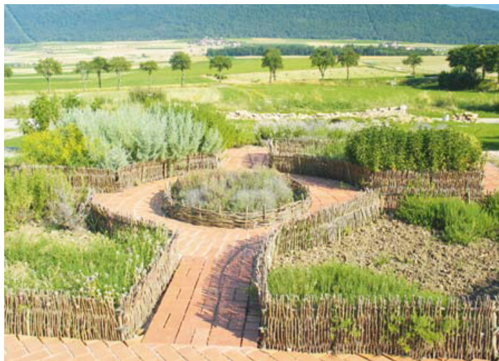
Le Jardidactic, un ancien outil remis au goût du jour

Le site a subi de profonds travaux d'entretien et a été agrémenté de panneaux didactiques qui guident les visiteurs intéressés à la découverte des savoir-faire horticoles, naturels et paysagers. Dominant le site, une table d'orientation présente le Jardidactic dans son ensemble avant de renvoyer les visiteurs vers différents panneaux traitant de sujets plus spécifiques relatifs aux jardins et aux techniques. /cwi