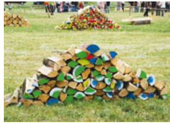
Art-récup ou ce qu'il reste du bois engagé dans le 11e concours neuchâtelois de bûcheronnage.

châtelois désormais installée en fixe (renseignements et réservations: 079 675 72 71). /cwi