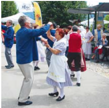
La Société de costume neuchâtelois en invité d'honneur.

avec chants et danses folkloriques neuchâteloises ainsi qu'un concert a capella par le groupe Voxset.