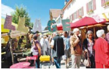
Il y avait foule à Fête la Terre les 25 et 26 août /fc

Près de 30'000 visiteurs au grand rendez-vous estival d'Evolgia. Fête la Terre et le concours neuchâtelois de bûcheronnage ont récolté les bénéfices d'une météo parfois incertaine, mais sans pluie et sans grande chaleur.